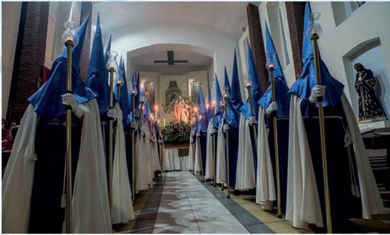
Ntro. Padre Jesús del Prendimiento