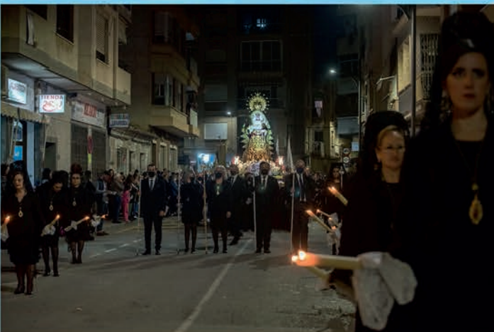
María Stma. de la Soledad