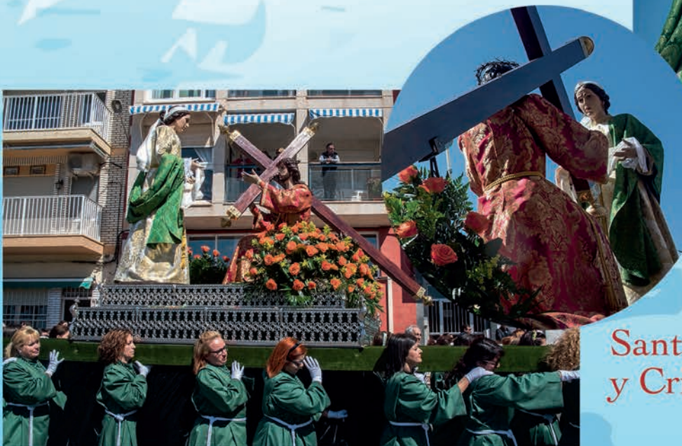
Santa Mujer Verónica y Cristo del Consuelo