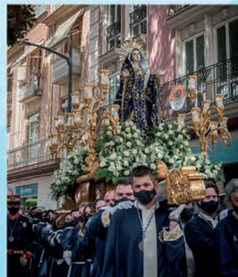
Ntra. Sra. Virgen de los Dolores