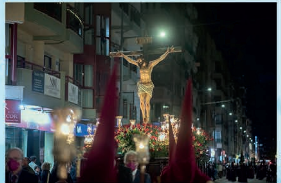
Stmo. Cristo de la Sangre