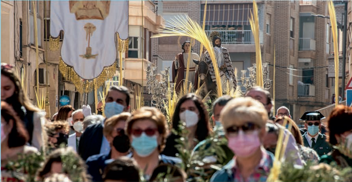
Entrada triunfal de Jesús en Jerusalén