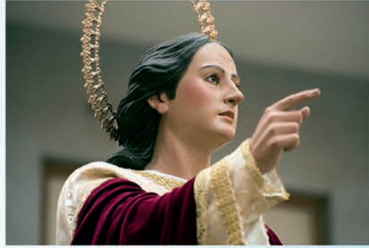
San Juan Evangelista