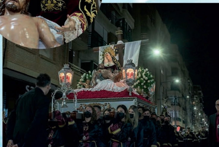
Cristo de la Misericordia y Stma. Virgen de la Piedad