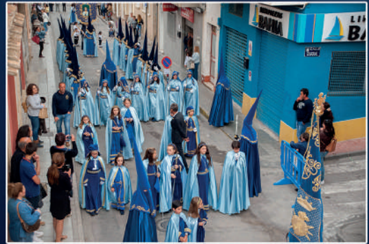
Oración en el Huerto

8 de Abril, 19,30h. Oración en el Huerto.