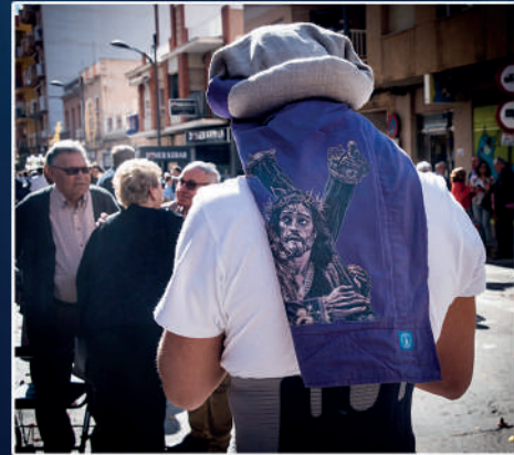
Ntro. Padre Jesús Nazareno