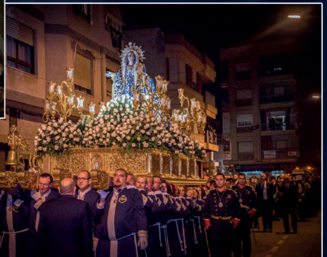
Ntra. Sra. Virgen de los Dolores