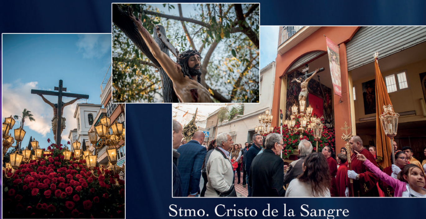
Stmo. Cristo de la Sangre