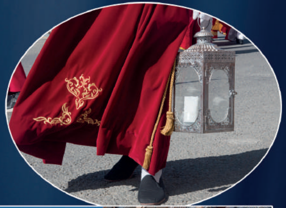
Ntro. Padre Jesús de la Columna