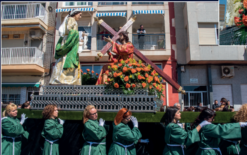
Santa Mujer Verónica y Cristo del Consuelo