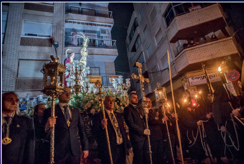
San Juan Evangelista