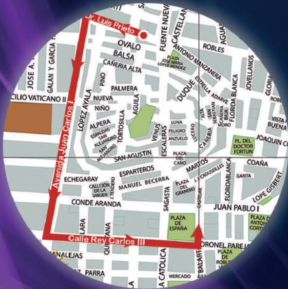
Virgen de la Estrella