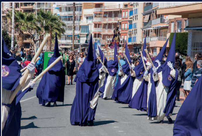
Ntro. Padre Jesús Nazareno