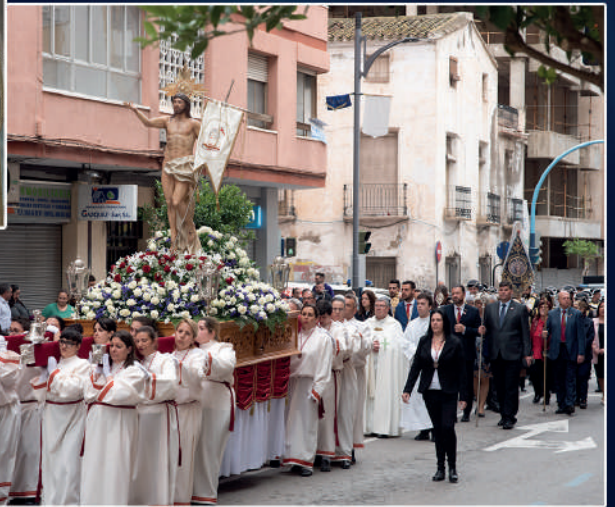
Stmo. Cristo Resucitado