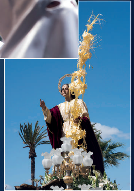
San Juan Evangelista