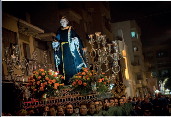
Santa Mujer Verónica