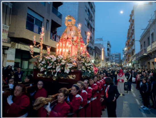
María Santísima de la Amargura y Ánimas