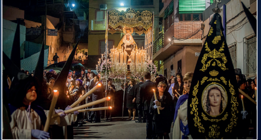
María Stma. de la Soledad