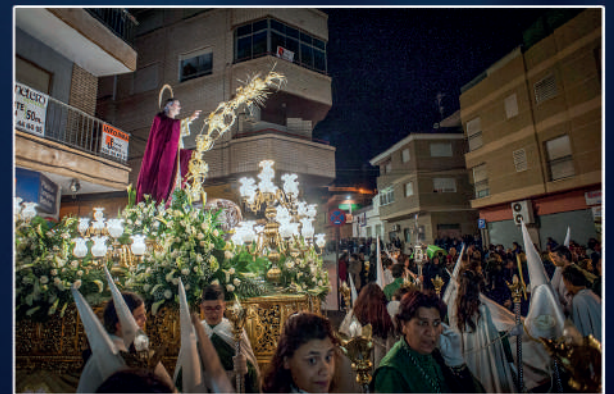
San Juan Evangelista