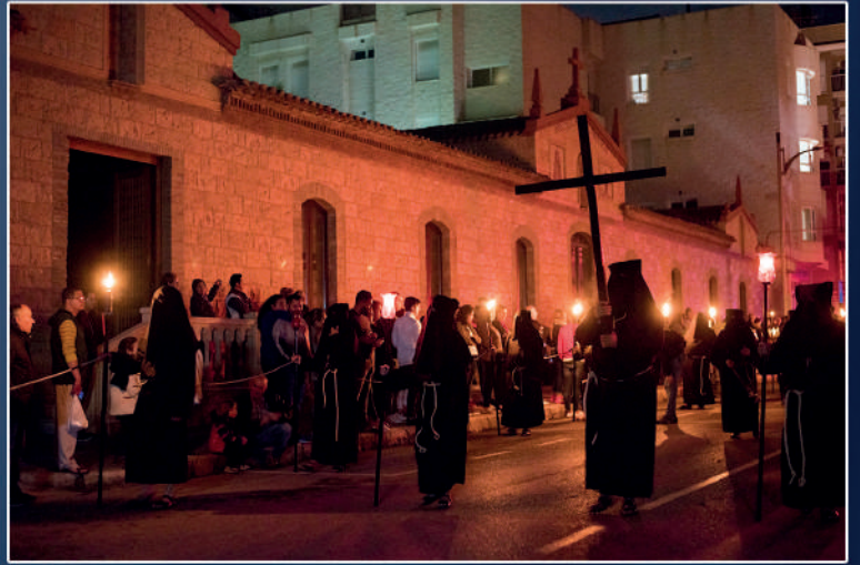
María Stma. de la Soledad