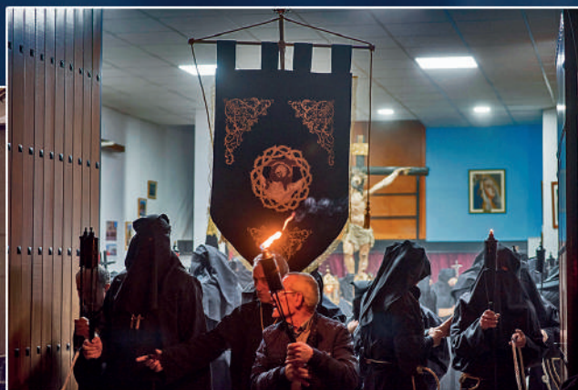
Stmo. Cristo de la Agonía