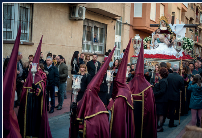
Cristo de la Misericordia y Stma. Virgen de la Piedad