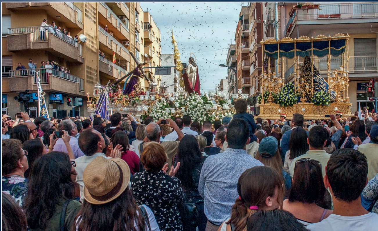
Ntra. Sra. Virgen de los Dolores